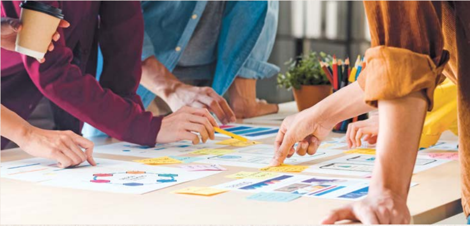
Sensibilisierung von Jugendlichen mit Materialien aus dem Aktionskoffer (Symbolbild)